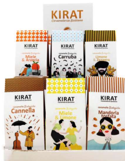
Espositore da 12 pezzi