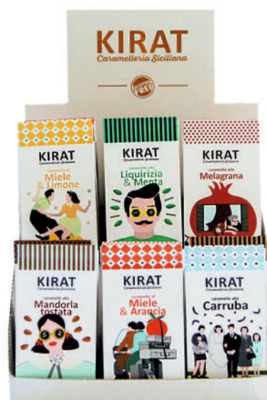
Espositore da 12 pezzi