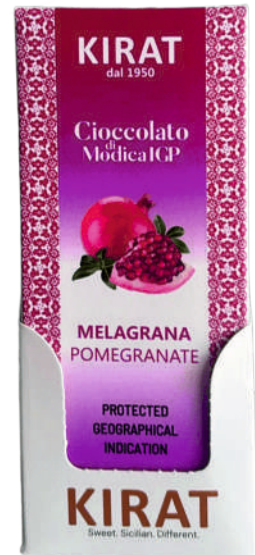
Blister da 12 pezzi