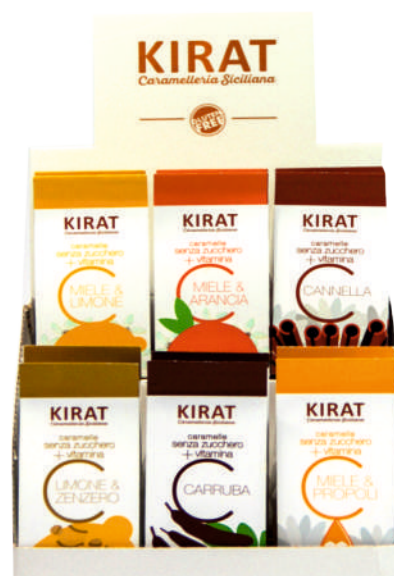
Espositore da 12 pezzi